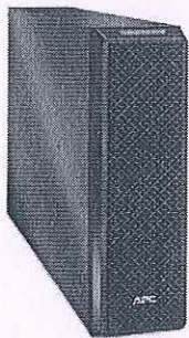
5kVA and 6kVA Battery Pack

Based on the following standards/ Basé sur les normes suivantes :